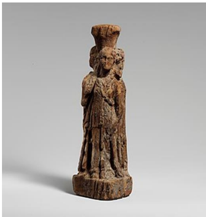
Juniper wood, Hekataion tolemaic, Egypt, c. 304

פסלונים של האלה הקטה, שנקראו הקטייה, נמצאו בכמויות גדולות בעיקר באזור אתונה, שם ניצבו בחזיתות בתים ובצמתי דרכים מצטלבות, ונעשה בהם שימוש בניחוש ובהגדת עתידות.